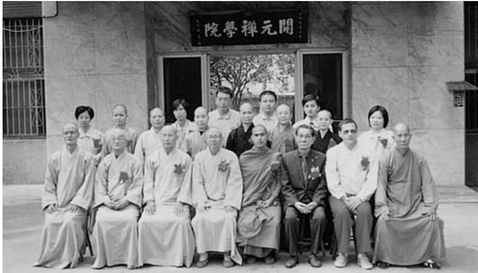
開元禪學院第三屆畢業典禮