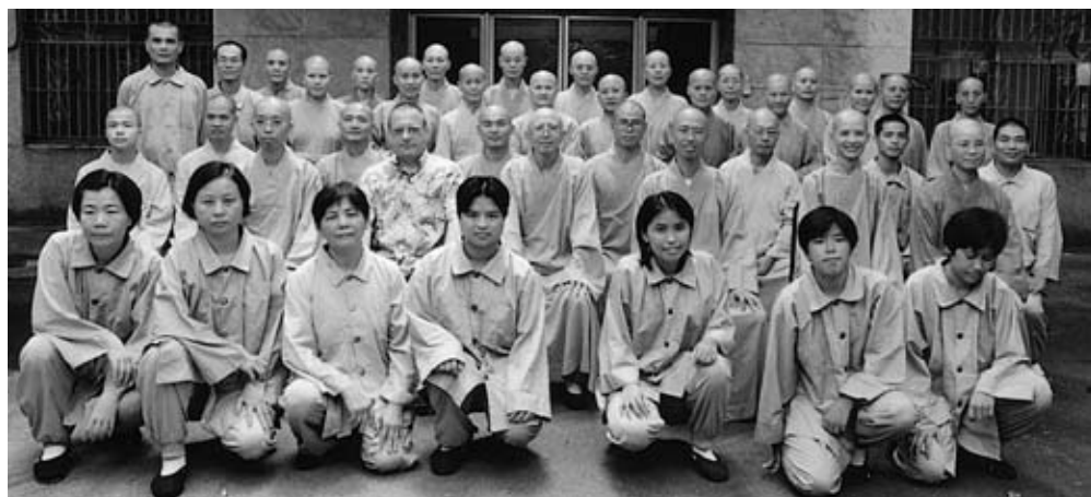
九十年度上學期全體 師生合影