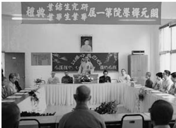
開元禪學院第一屆研究生結業畢業典禮