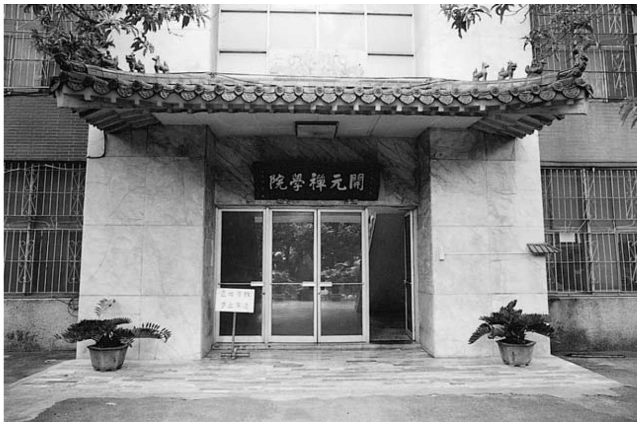
開元禪學院本院正面圖

開元寺住持悟慈法師秉持著興學之願望，以及「陶鑄人才而後法輪方能常轉」之理念，發願興辦僧伽教育以培育僧青年的法身慧命，並建立學佛者之正確理念與知見。1959年，悟慈法師